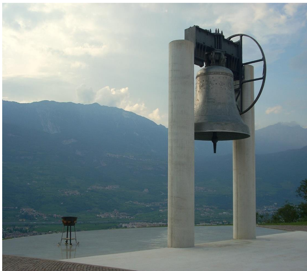
Il suono ‘imposto’: campana dei Caduti, Rovereto.

Renzo Piano sostenne che “ l’architettura è un’arte imposta ” che ci troviamo di fronte, tuttavia occorre precisare che, mentre possiamo ancora evitare lo sguardo di fronte a quel brutto condominio, non possiamo non sentire i 12 rintocchi delle campane di mezzogiorno a meno che non ci tappiamo forzatamente le orecchie.