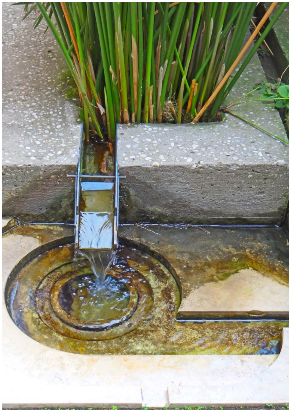
Figura 1 – Suoni d’acqua. Carlo Scarpa – Fondazione Querini Stampalia, Venezia.

vincere che la città continua la sua vita felice... questa è la musica che senti” (Calvino, 1995: 66-71).