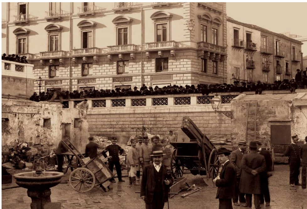
Figura 2 – La Vucciria (il cui significato è confusione), storico mercato di Palermo.